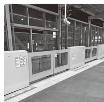
参考：新越谷駅に設置されたもの