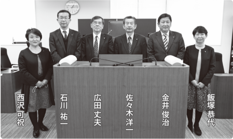
草加市議会令和3年2月定例議会が2月24日から3月23日まで開催されました。